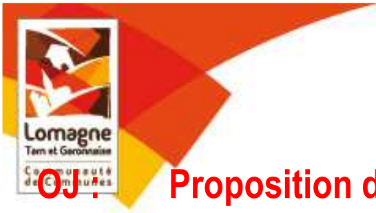
Schéma Directeur d'Aménagement Numérique (SDAN)

OU : Proposition d'adhésion au Syndicat Mixte, approbation des statuts désignation d'un délégué titulaire et un délégué suppléant