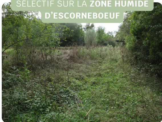
FAUCHE ANNUELLE ET ABATTAGE SÉLECTIF SUR LA ZONE HUMIDE D'ESCORNEBOEUF