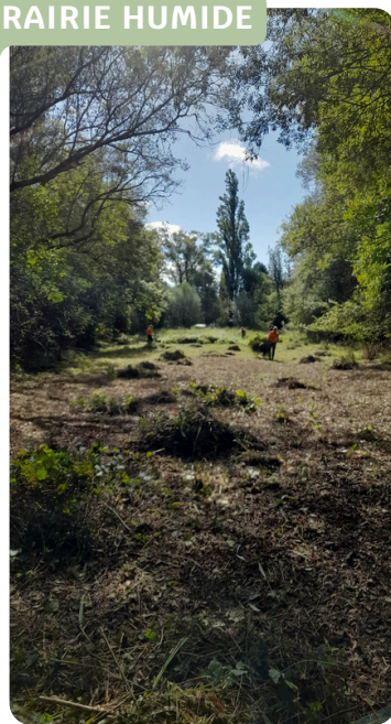
ENTRETIEN SÉLECTIF D'UNE HAIE ANNUELLE SUR LES PRAIRIES HUMIDES DE LARRAZET